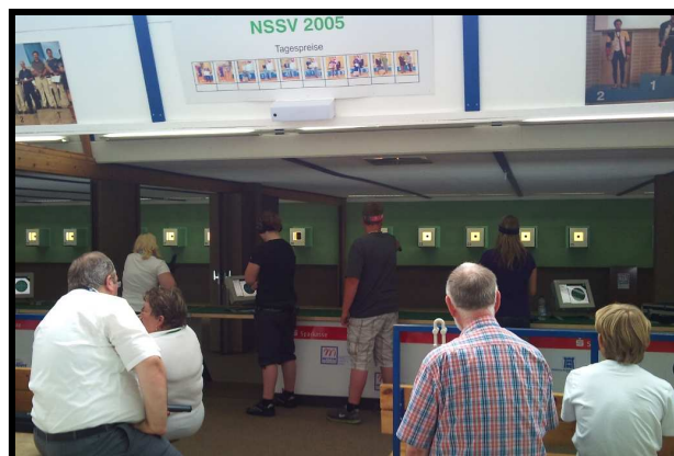
Aufsicht und Publikum für die 4er Gruppe